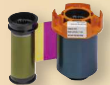
カラーインクリボン