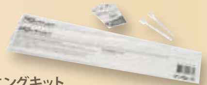
クリーニングキット