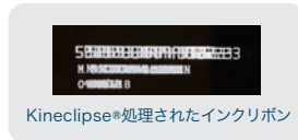
Kineclipse®処理されたインクリボン