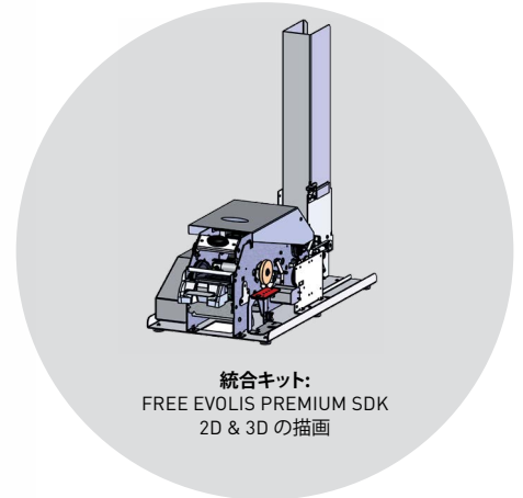
統合キット: FREE EVOLIS PREMIUM SDK 2D & 3D の描画