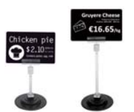
マグネット式タグホルダー 8cm, 12cm

用途やシーンに合わせて、15種類以上のアクセサリからお選びいただけます。※金額・詳細はお問い合わせください