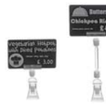
タグクランプ 4cm, 8cm