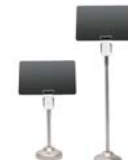
金属製 ビュッフェ用 ロングスタンド 10cm, 18cm