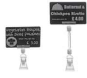
タグクランプ 4cm, 8cm