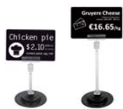
マグネット式タグホルダー 8cm, 12cm

用途やシーンに合わせて、15種類以上のアクセサリからお選びいただけます。※金額・詳細はお問い合わせください