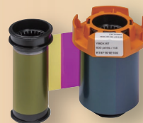
カラーインクリボン