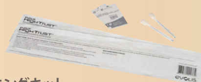
クリーニングキット