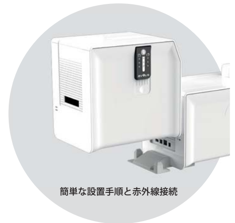
簡単な設置手順と赤外線接続